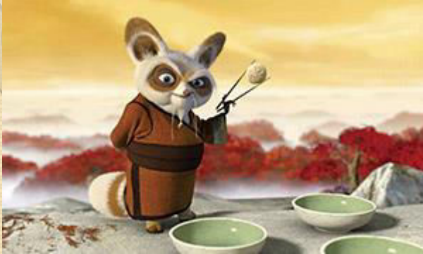
Kung Fu Panda 3 – «Кунг-фу панда 3»

Легендарные приключения панды по имени По продолжают в этом мультфильме. Ему предстоит важное сражение со злым духом Каем. Только настоящий герой сможет остановить его и предотвратить беду. Великий Мастер Шифу находит древние писания и говорит следующую фразу: