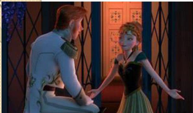
Frozen – «Холодное сердце»

Давайте вспомним прелестную и наивную принцессу Анну, которая в день коронации ее сестры Эльзы повстречала на приеме Ханса. Тринадцатый принц Южных островов предложил ей руку и сердце, и девушка согласилась. В этом эпизоде юная красавица рассказывает избраннику о белой пряди волос в своей прическе. Девушка не знает, что таков результат магии ее старшей сестры.